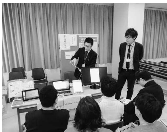
ICT 機器の説明の様子

平成29年度は、道内の訪問介護事業所における ICT 機器の活用促進を目的とし、ホームヘルプサービス ICT 機器活用実態調査を実施いたしました。本調査により、道内の活用状況や ICT に関する意識を把握することができました。