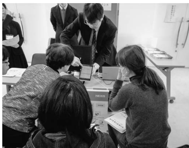
展示ブースの様子